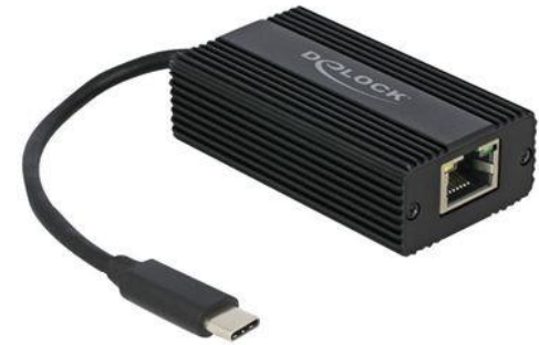
Adattatore di rete GigaBit USB-C

Aggiunge un'interfaccia di rete al Rocktab L110 tramite la porta USB Type-C