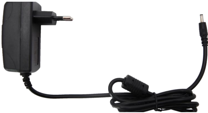
Alimentazione per la docking station