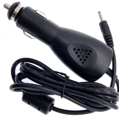
Alimentatore per auto per montaggio su veicolo