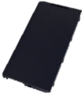
Rockbook X550 Ersatzbatterie